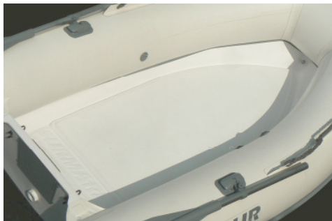
Standard basic look

Die Schlauchboote von Easy Range haben ein einzigartigen Stil und hohe Leistung, die durch den starren Boden gewährleistet sind. Sie können mit den optionalen Auto-trim Klappen verbessert werden. Die Ästhetik kann man mit synthetischen Teak Fussboden verschönern. "Extra" serienmäßig: "double shell" Fiberglas Struktur – Schlauchen als ORCA Neopren - Hebenhaken und Bogenhaken – robust Handlauf auf Seil - Luftpumpe – abnehmbare Rudern – Gehäuse auf dem Bogen für 12 lt Tank (EASY 320) oder 25 lt (EASY 370 / 400) und Kraftstoffleitung mit Ausgang zum Cockpit – Gehäuse für die Batterie im Heckbereich (EASY 370 / 400).