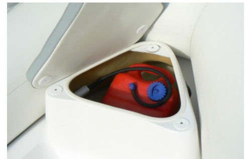
Mod. Easy 320 / 370 / 400