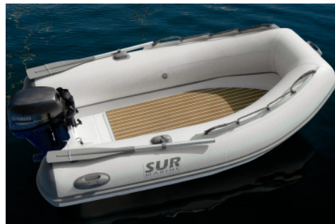
Mod. Easy 270 / 290