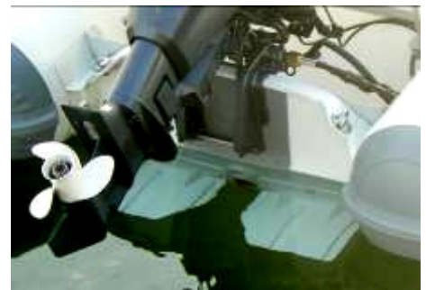
Standard: "auto trim" elastic flaps