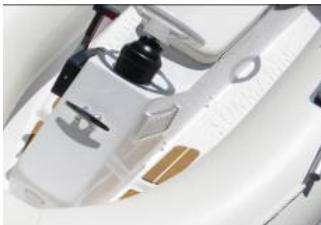
Personalizzazioni / customizations

Ein innovatives "Spielzeug" für Ihre Yachten, kraftvoll und elegant, mit einer langen Sitzbank bis 3 Passagiere. Mehr als 20 Knoten mit nur 10 PS dank der länglichen Rumpf, die Leichtigkeit und die serienmäßig "auto trimmen" Klappe. "Extra" serienmäßig: "double shell" Fiberglas Struktur – Schlauchen als ORCA Neopren - verstellbares Lenkrad (ST270) - "auto trim" elastische Klappen - Hebenhaken und Bogenhaken - Speichertasche - Gehäuse für Tank 12/25 lt und Starterbatterie - Luftpumpe – abnehmbare Rudern (ST 250: Paddel).