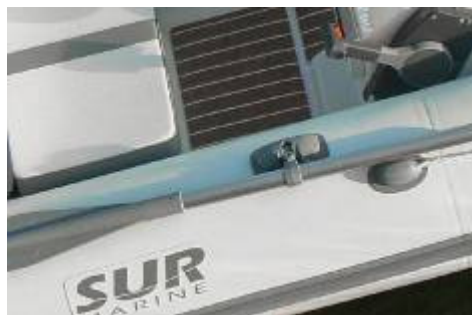
Standard: pagliolo in teak / Teak footrest