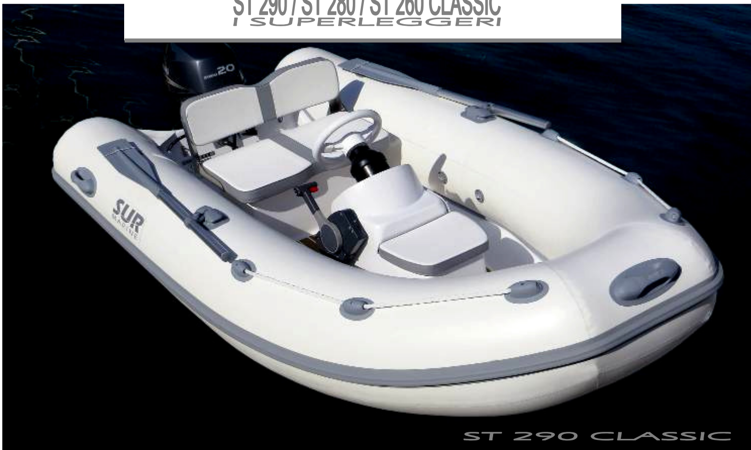
ST 290 CLASSIC