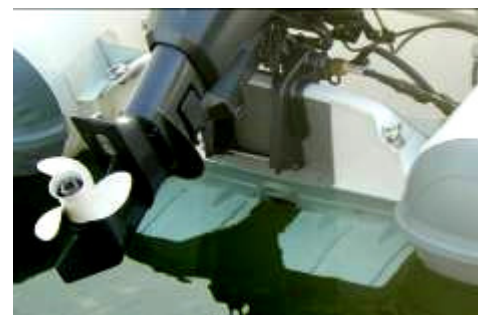
Standard: "auto trim" elastic flaps