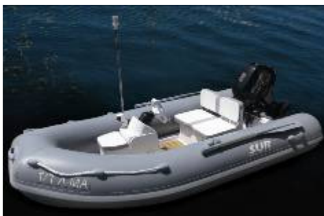
ST 290 CLASSIC "Neptune Grey" con luci / with lights

Sicher der leichteste mit die besten Leistungen in der Klasse, diese Familie von Schlauchbooten ist mit unserer Technologie "double shell" realisiert (Struktur mit 2 Fiberglasschalen ohne weitere montierten Teile). Der Rumpf ist für die Navigation besonders entworfen und zusammen mit die "auto trim" Klappen " garantieren top-Performance. "Extra" serienmäßig: "double shell" Fiberglas Struktur - Schlauchen als ORCA Neopren - "auto trim" elastische Klappen - Hebenhaken - Bogenhaken - Konsolle mit Schließfächer und Speichertasche - Schließfächer mit Gehäuse für Tank 12 lt - Gehäuse für Starterbatterie - Luftpumpe - Rudern.